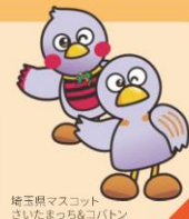
埼玉県マスコット さいたまっちょ&コパン